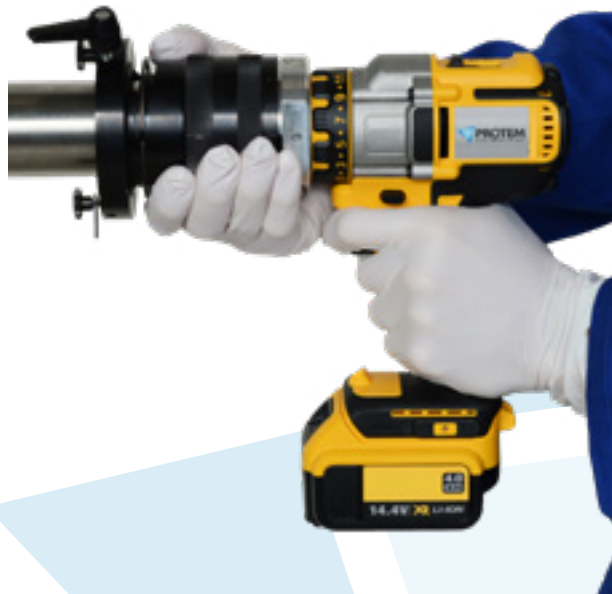
SE65 с беспроводным электрическим приводом