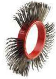
BRISTLE BLASTER® BELT, STEEL, 11 MM