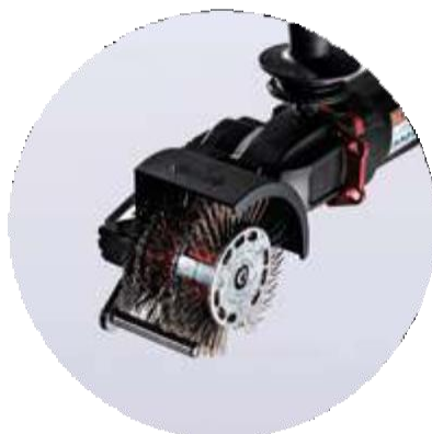
BRISTLE BLASTER® DOUBLE