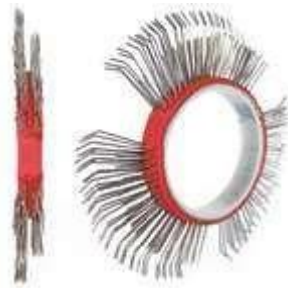
BRISTLE BLASTER® AXIAL BELT, STAINLESS STEEL, 11 MM, RIGHT