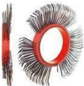
BRISTLE BLASTER® AXIAL BELT, STEEL, 11 MM, LEFT