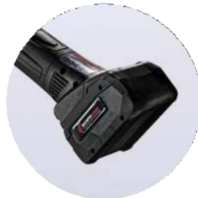
BRISTLE BLASTER® CORDLESS