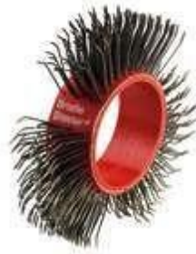
BRISTLE BLASTER® BELT, STEEL, 23 MM