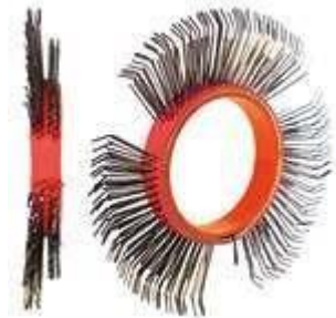
BRISTLE BLASTER® AXIAL BELT, STEEL, 11 MM, RIGHT