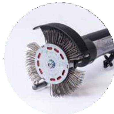
BRISTLE BLASTER® AXIAL