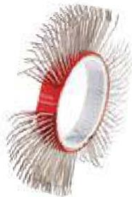
BRISTLE BLASTER® BELT, STAINLESS STEEL, 11 MM