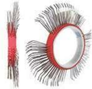
BRISTLE BLASTER® AXIAL BELT, STAINLESS STEEL, 11 MM, LEFT