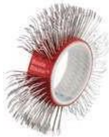
BRISTLE BLASTER® BELT, STAINLESS STEEL, 23 MM