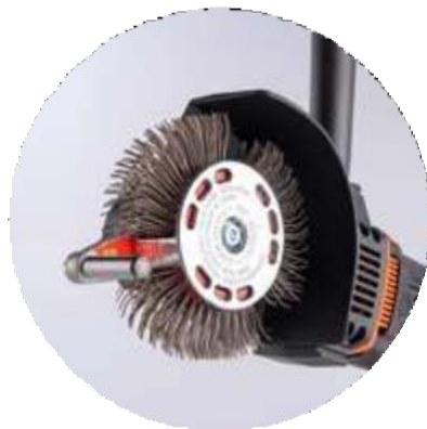
BRISTLE BLASTER® ELECTRIC