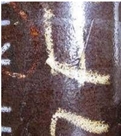
API 5L Piping