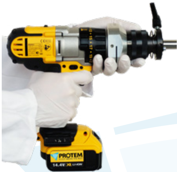
SE25 с беспроводным электрическим приводом